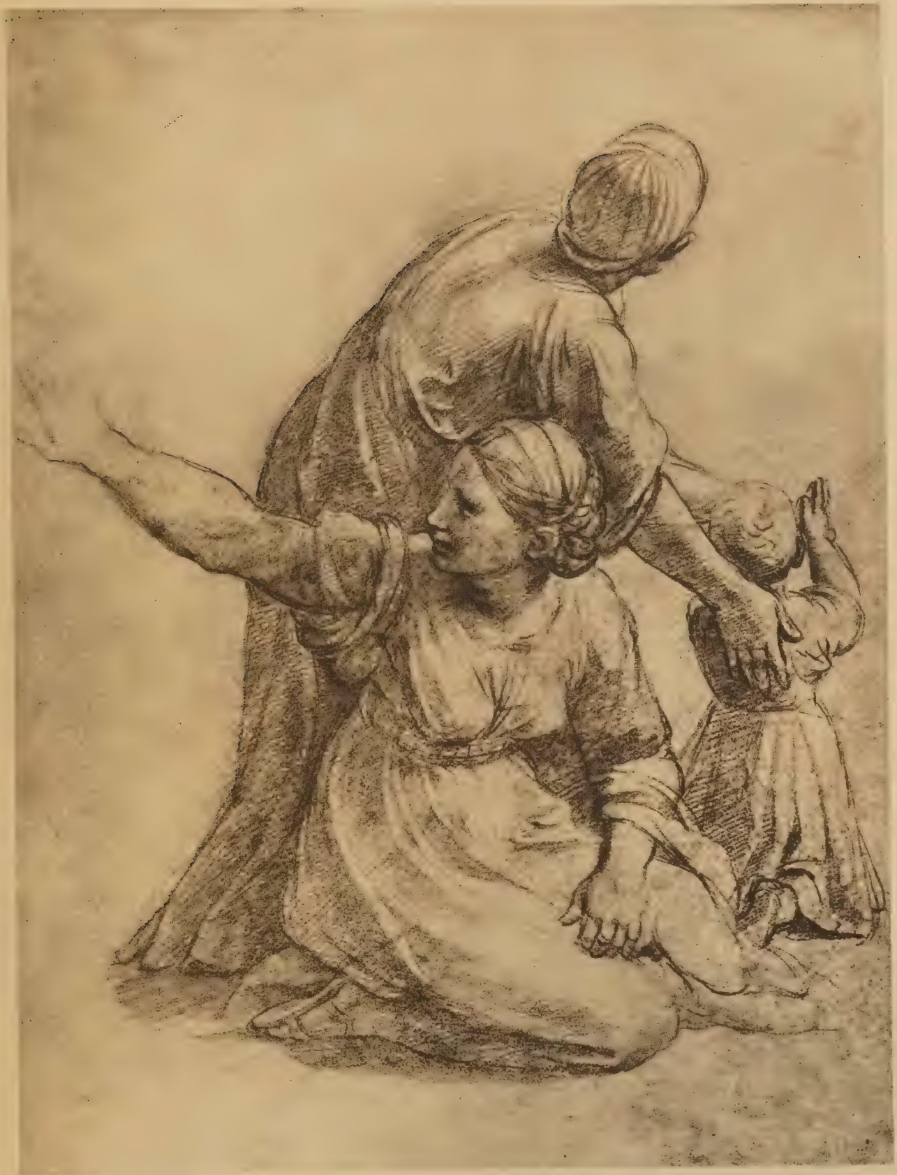
Etude pour le groupe central de la fresque de l'«Incendio di Borgo» au Vatican